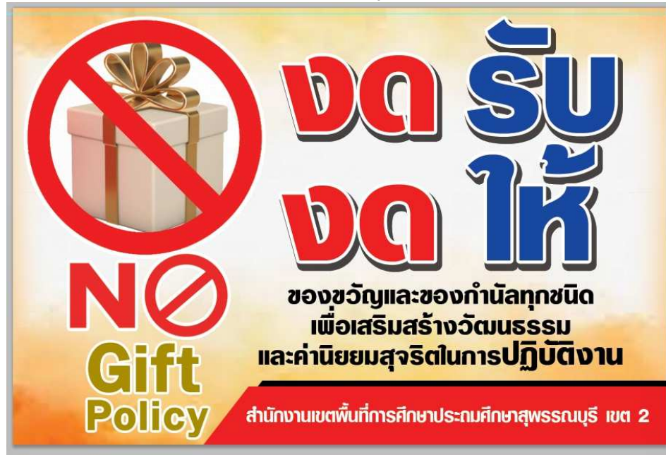
ภาพ : สติ๊กเกอร์ประชาสัมพันธ์

สำนักงานเขตพื้นที่การศึกษาประถมศึกษาสุพรรณบุรี เขต 2 ได้จัดทำสติ๊กเกอร์ประชาสัมพันธ์ “งดรับ งดให้ ของขวัญและของกำนัลทุกชนิด” และนำไปติดไว้ในจุดต่าง ๆ บริเวณสำนักงาน เพื่อประชาสัมพันธ์นโยบายการไม่รับของขวัญ