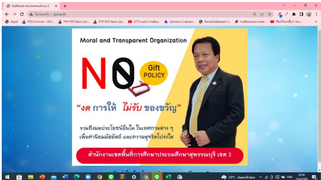
ภาพ : การประชาสัมพันธ์สร้างการรับรู้ผ่านสื่ออิเล็กทรอนิกส์ บนหน้าเว็บไซต์เขตสุจริต

สำนักงานเขตพื้นที่การศึกษาประถมศึกษาสุพรรณบุรี เขต 2 ได้สร้างการรับรู้เกี่ยวกับนโยบายไม่รับของขวัญ (No Gift Policy) โดยจัดทำเป็นแผ่นป้ายภาพโฆษณา (banner) ไว้ที่หน้าเว็บไซต์เขตสุจริต เพื่อประชาสัมพันธ์ให้ทราบโดยทั่วไป