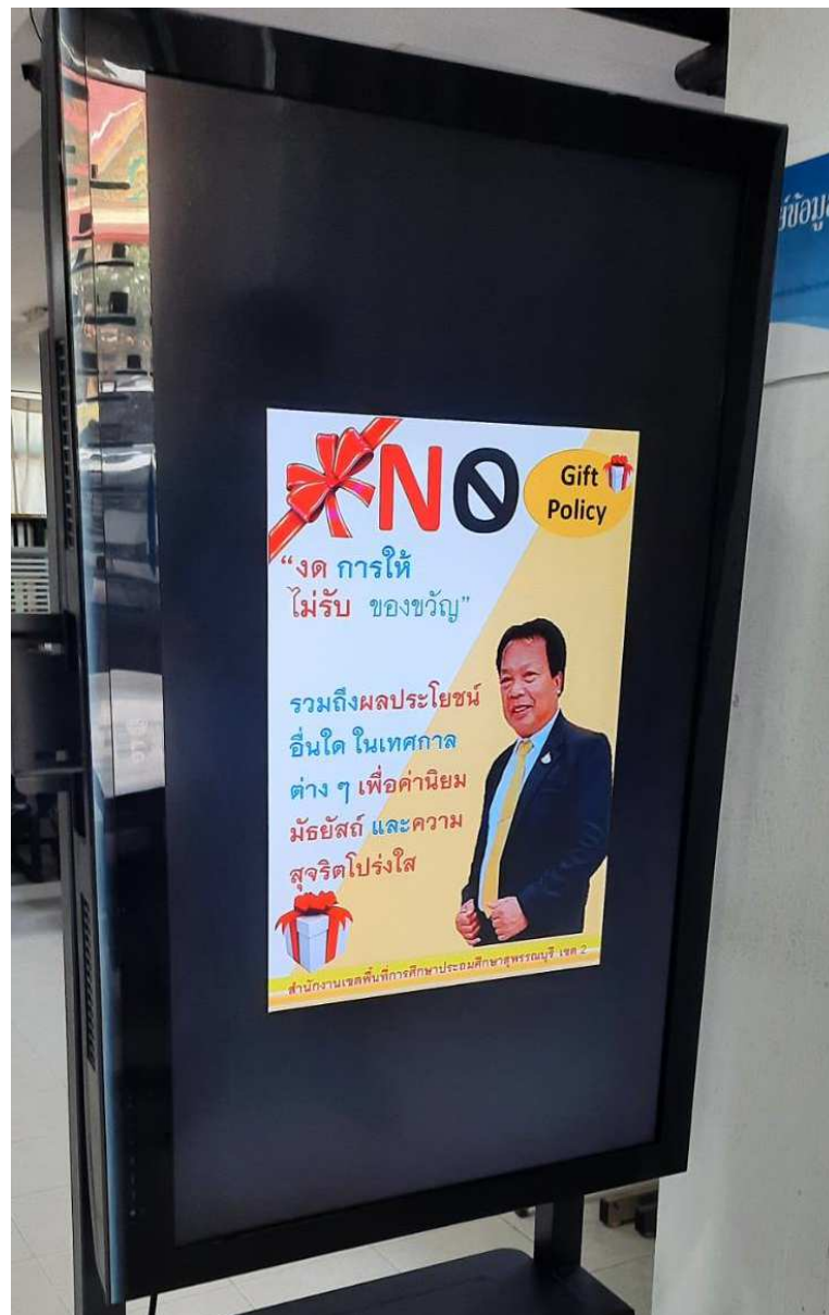
ภาพ : ป้ายประชาสัมพันธ์หน้าสำนักงานเขตพื้นที่การศึกษา

สำนักงานเขตพื้นที่การศึกษาประถมศึกษาสุพรรณบุรี เขต 2 ได้จัดทำป้ายประชาสัมพันธ์นโยบายการไม่รับของขวัญ (No Gift Policy) ไว้ที่บริเวณหน้าสำนักงานเขตพื้นที่การศึกษา เพื่อเผยแพร่และประชาสัมพันธ์ให้ผู้ที่มาติดต่อทุกคนได้รับทราบ