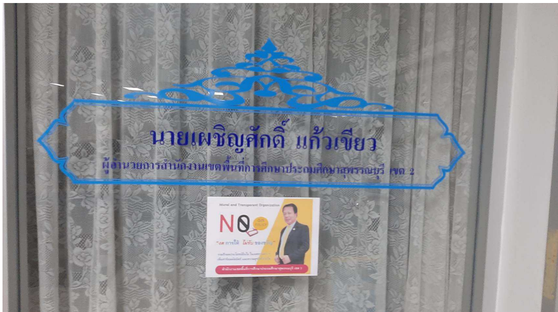
ภาพ : ติดสติ๊กเกอร์ในสำนักงาน